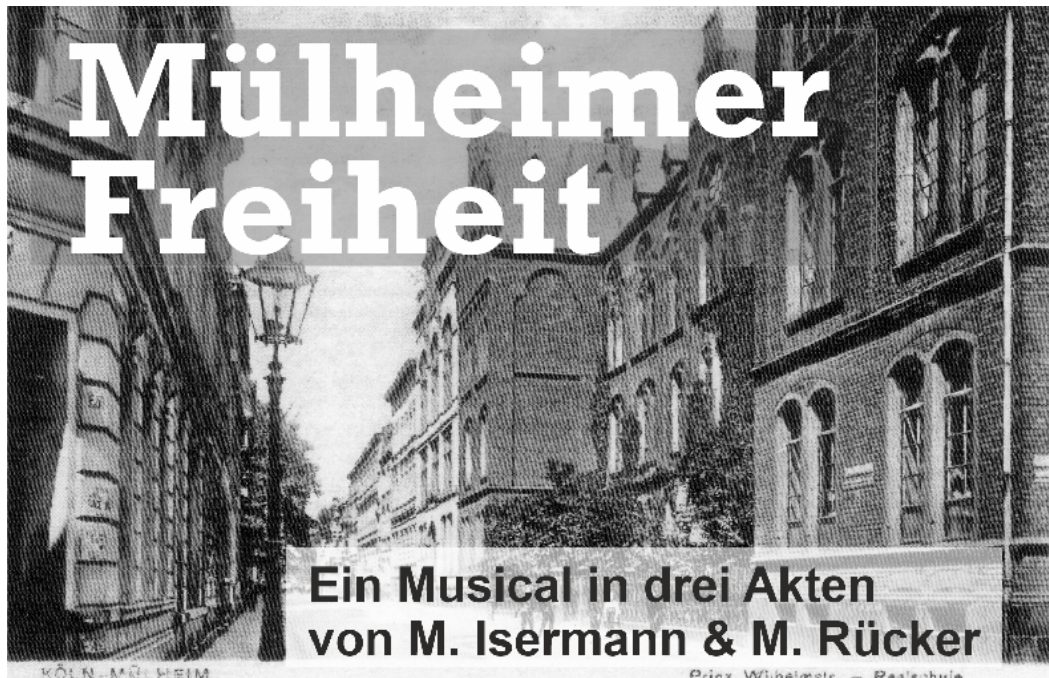
Postkarte aus dem Besitz von H.-O. Nickolav, Quelle: 150 Jahre. Festschrift des Rhein-Gymnasiums